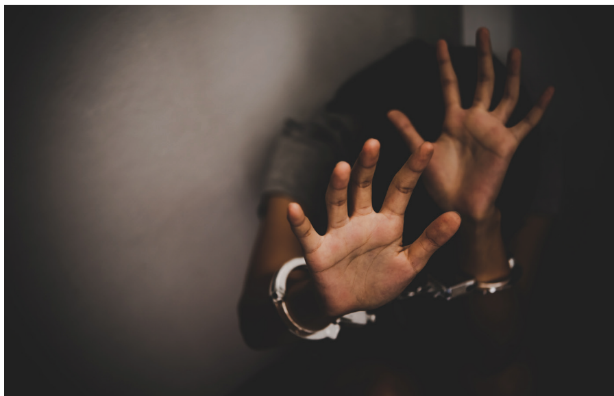
FOTOGRAFIA 1: Trafikimi i qenieve njerëzore

Sipas ligjit, viktimat që detyrohen të kryejnë veprime të paligjshme nga trafikantët nuk dënohen për ato vepra të kryera si rezultat i trafikimit.