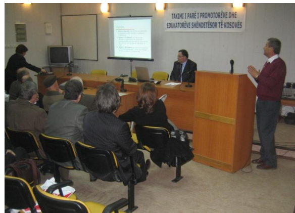
Foto nga takimi i parë i edukatorëve dhe promotorëve shëndetësor, 7 prill 2006

Gjatë vitit 2008 janë realizuar dhe koordinuar aktivitetet me rastin e festave ndërkombëtare mjedisore nga Ministrinë e Mjedisit dhe Planifikimit Hapësinor në bashkëpunim me MASHT-in në kuadër të fushatave për vetëdijësim si: “Fushata me Moton në Kosovën e re me imazh të ri”, pastaj MASHT me Institutin Kombëtar të Shëndetësisë Publike dhe Ministrinë e Shëndetësisë, me rastin e datave ndërkombëtare si dita e luftës kundër duhanit, dita e luftës kundër tuberkulozit, etj.