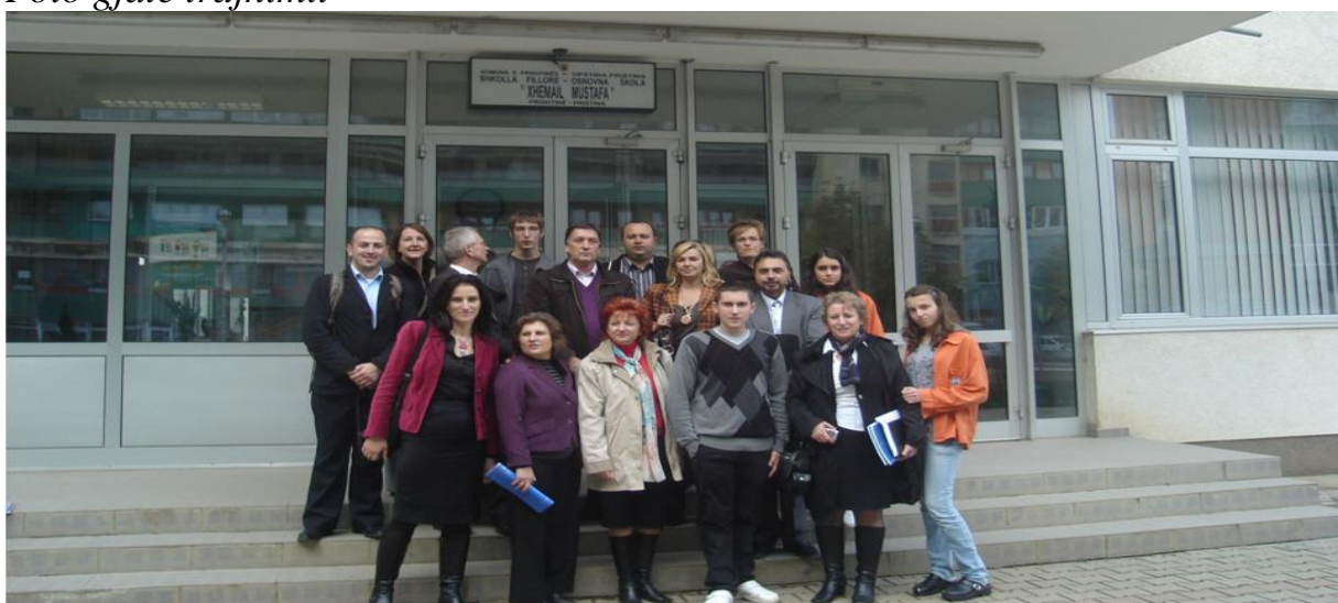
Përfaqësues të rrjetit evropian kanë vizituar dy shkolla fillore ne kryeqytet "Hasan Prishtina" dhe "Xhemajl Mustafa".