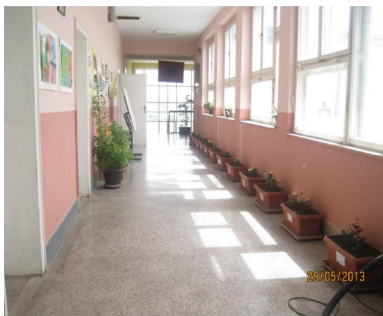
Shkolla fillore e mesme e ulët Rasim Kiqina-Drenas, vendi i parë