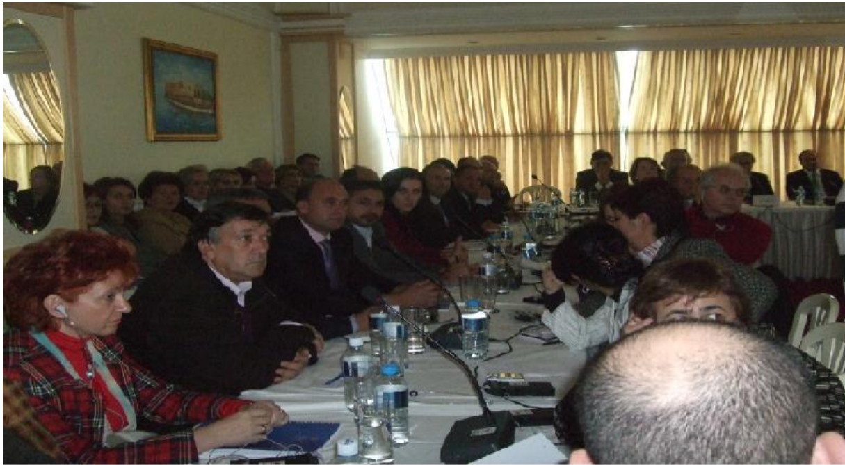
Promovimi i strategjisë SHPSH, tetor 2009