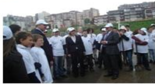
Foto nga Dita e Tokës- 22 prill, sh.f ‘Dardania’ , Prishtinë 2009

Në kuadër të fushatës për vetëdijësim me moton “Në Kosovën e re me imazh të ri” Ministria e Mjedisit dhe Planifikimit Hapësinor në bashkëpunim me MASHT, Ministrinë e Bujqësisë Pylltarisë dhe Zhvillimit Rural dhe disa organizata si: UNDP, Eptisa, LSD ka shënuar Ditën Botërore të Ujit-22 Marsin, Ditën Botërore të Tokës- 22 Prillin, dhe Ditën Botërore të Mjedisit - 5 Qershorit. Objektivi i këtyre aktiviteteve është sensibilizimi i komunitetit dhe institucioneve të Kosovës në brengat e mjedisit. Ministria e Arsimit, ka botuar materiale edukative (posterë), ndërsa në bashkëpunim me Ministrinë e Mjedisit, janë vlerësuar punimet e nxënësve në konkursin shpërblyes me rastin e 5 Qershorit- Ditës së Mjedisit.