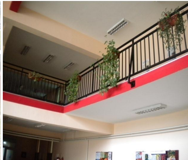
Shkolla "Martin Camaj- vendi i dytë