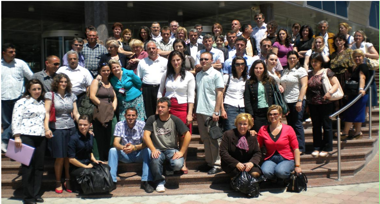
Foto me mesimdhënesit e trjnuar