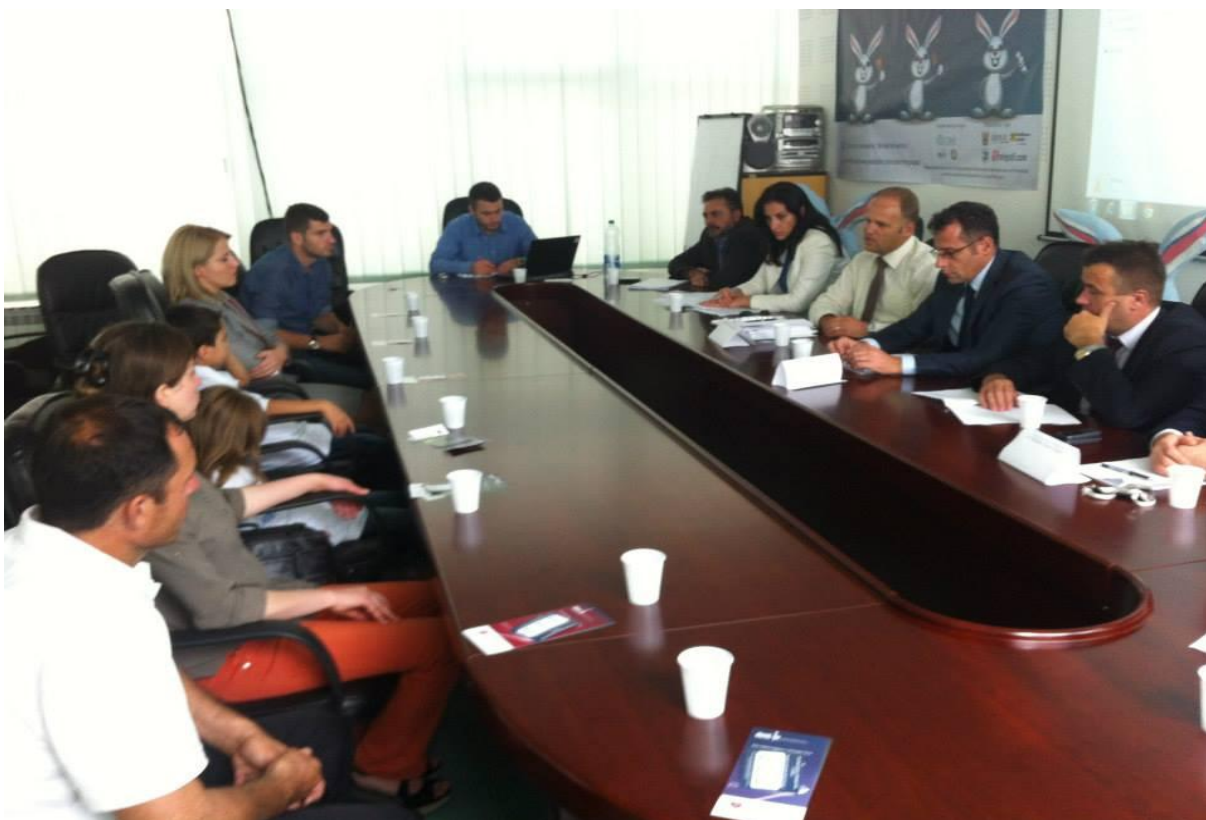
Foto nga Tryeza e rrumbullakët 12 shtatori –dita botërore e shëndetit oral, 2013

Policia e komunitetit në bashkëpunim me Ministrinë e Arsimit, bazuar edhe në programin shkollat promovuese të shëndetit) ka mbajtur debate me mësimdhënës, drejtorë shkollash, nxënës dhe prindër për pasojat që sjell përdorimi i substancave narkotike në 6 komuna: Prishtinë, Pejë, Gjakovë, Dragash, Ferizaj dhe Mitrovicë.