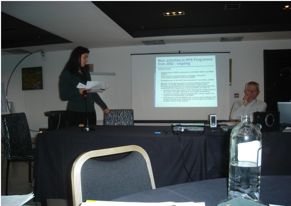
Foto nga punëtorja e mbajtur në Mavrovë të Maqedonisë me koordinatore të Rrjetit SHE, Paraqitja nga Kosova, koordinatore e programit SHPSH

në forcimin e planit nacional strategjik për programin SHPSH, që është mbajtur në Mavrovë të Maqedonisë . Është organizuar edhe vizita në dy shkolla fillore të kryeqytetit, me rastin e ardhjes së përfaqësuesve të rrjetit evropian në Kosovë. Në këtë punëtori Kosova, ka prezantuar të arriturat dhe shumë i rëndësishëm ishte edhe këmbimi i përvojave me shtetet e tjera të Evropës, pjesëmarrëse në punëtori si Maqedonia, Kirgistani, Rusia, Moldavia, Kazakistani, Gjorgjia, etj.