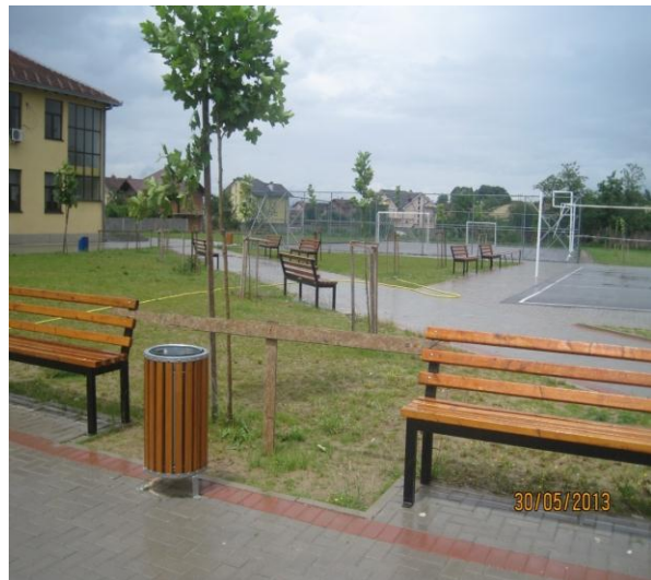
Shkolla "4 dëshmorët"-Ratkoc, vendi i tretë

OJQ –KICKOMS – në bashkëpunim me KNSHPSH ka filluar realizimin e aktiviteteve promovuese për shëndetin oral, me moton: "Dhëmbë të shëndoshë, fëmijë të lumtur". Java e promovimit të shëndetit ka filluar në shkollën "Hasan Prishtina", në Prishtinë, ku edhe është mbajtur manifestimi qendror me pjesëmarrjen edhe të ministrit të shëndetësisë.