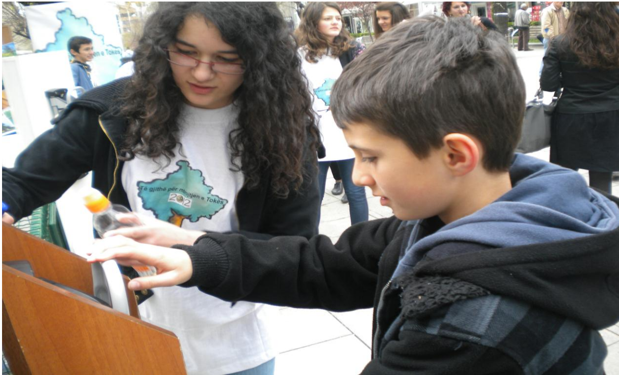
Aktivitete me rastin e dites Boterore te Tokës ne Sheshin Nënë Tereza -Prishtinë

Kete dite aktivitetet janë shënuar edhe në sheshin “Nëna Terezë” Prishtinë në bashkëpunim me USAID Basic Education Program dhe nxënës të shkollave fillore me moton “Redukto, Ripërdor dhe Riciklo” . Edhe ne Parkun “Gërmia” në Prishtinë –është realizuar programi me nxënës të shkollave fillore nga Komuna e Prishtinës për mbëltimin e fidanëve dhe luleve të ndryshme.