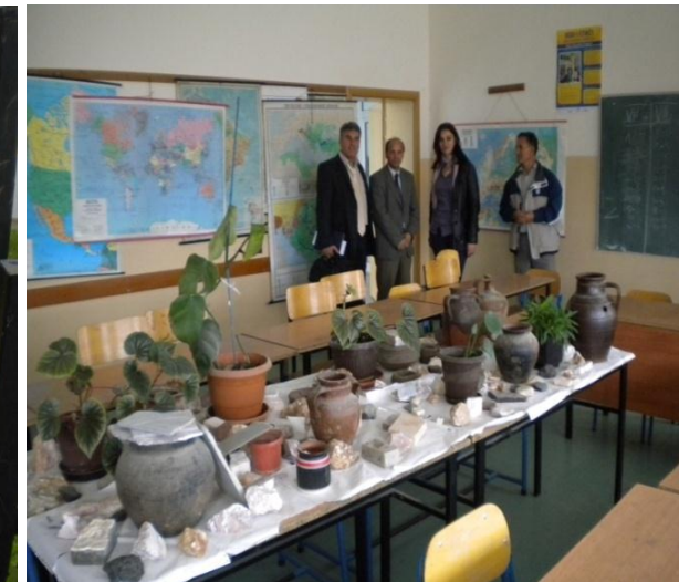
Shkolla "Kajtaz Ramadani- Kijevë, vendi i tretë

Ministria e Mjedisit gjegjësisht Departamenti për Mbrojtjen e Mjedisit gjatë viteve 2009-2013 ka realizuar objektivat në bazë të prioriteteve të parapara me plan dhe program për vitet e lartcekura si dhe me obligimet që dalin nga korniza ligjore për mbrojtjen e mjedisit si dhe Strategjia për Shkollat Promovuese të shëndetit në Kosovë 2009-2018 gjegjësisht Plani i Veprimit për periudhën 2009-2013. Gjatë këtyre viteve janë realizuar një mori Ligjërata në shkolla të mesme të ulëta për problemet mjedisore si në Rajonin e Mitrovicës, Gjilanit , Pejes, Gjakoves, Prishtines. Janë përfshirë gjithsejt 55 shkolla fillore me 3630 nxënës të niveleve prej Kl.V deri klasën e IX dhe një nr i konsiderueshëm i personeli arsimor. Gjatë kësaj periudhe kohore nëpër shkolla për nxënës janë shpërndarë materiale të ndryshme për edukim dhe ndërgjegjësim mjedisor si: Broshura "Edukimi dhe Ndërgjegjësimi Mjedisor " Revista "Mjedisi", Fletëpalosje, Postera të ndryshëm si dhe Raporte të ndryshme mjedisore etj.