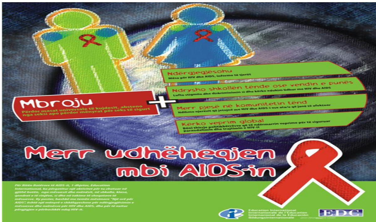
Udhëzuesi i shpërndarë ne shkolla me rastin e 1 dhjetorit – Ditës ndërkombëtare kundër HIV/AIDS, 2008

Gjithashtu janë shpërndarë edhe materiale edukative shëndetësore në shkolla për gripin A (H1N1) përmes drejtorive komunale të arsimit, të realizuara në bashkëpunim me Institutin Kombëtar të Shëndetit publik dhe Organizatën Botërore të Shëndetit.