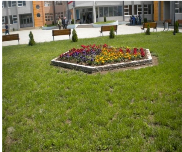
Shkolla "Liria" Milloshevë – vendi i parë