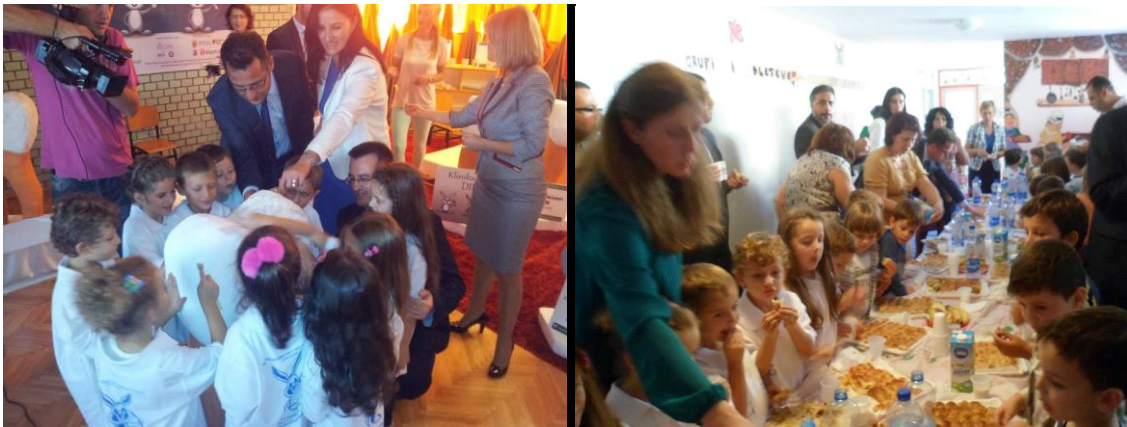
12 shtatori –dita botërore e shëndetit oral- kopshti-Dielli, 2013

Me 12 shtator 2013 është shënuar edhe dita ndërkombëtare e shëndetit oral, ku KNSHPSH bashkë me OJQ KISCKOMS kanë realizuar edhe një tryeze të rumbullaket, ku si rekomandim ka dalë që së që në institucionet parashkollore, fillore dhe të mesme të Republikës së Kosovës, të promovohet të ushqyerit e shëndetshëm duke evituar konsumimin e pijeve të gazuara dhe ushqimeve shumë të kriposura dhe të sheqerosura që mund të ndikojnë negativisht në shëndetin e fëmijëve.