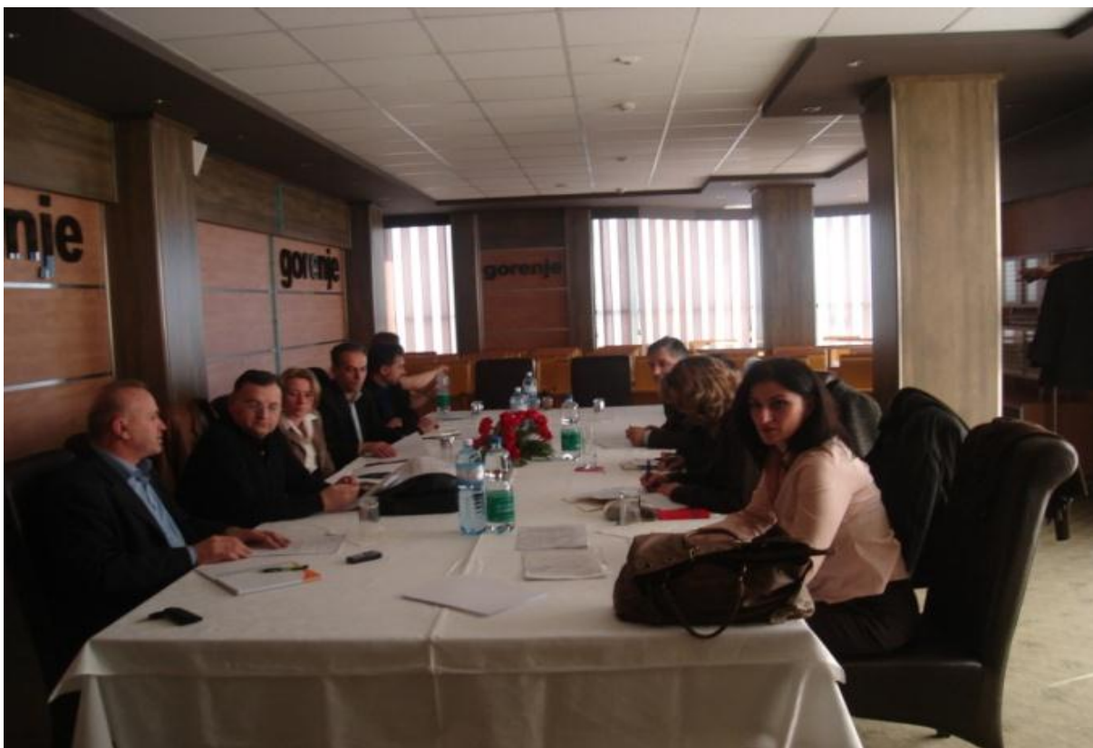
Foto nga grupet punuese gjatë hartimit të strategjisë për shkollat promovuese të shëndetit

Ministria e Arsimit, së bashku me Ministrinë e Shëndetësisë, Ministrinë e Mjedisit dhe Planifikimit Hapësinor dhe Ministrinë e Kulturës, Rinisë dhe Sportit ka hartuar dhe promovuar “Strategjinë për Sport” si dhe “Strategjinë për Shkollat Promovuese të Shëndetit 2009-2018