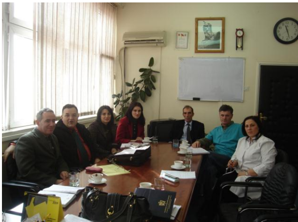
Takimi ne Qendrën e Mjekësisë Familjare në Gjilan