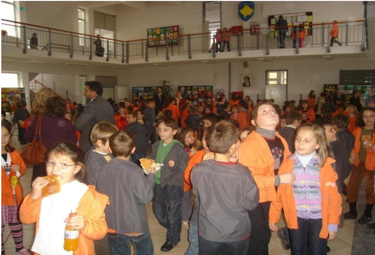
Pamje nga vizita në shkollën "Xhemajl Mustafa" Prishtinë, 2009

Në muajin prill 2010 është organizuar java e gjelbërimit të shkollave, MASHT bashkë me Ministrinë e Bujqësisë kanë shpërndarë 10 000 fidane në shkollat e Kosovës, për ta gjelbëruar mjedisin përreth tyre. Aksioni është realizuar me sukses dhe synohet që edhe në vitet tjera të vazhdohet me nisma të tilla.