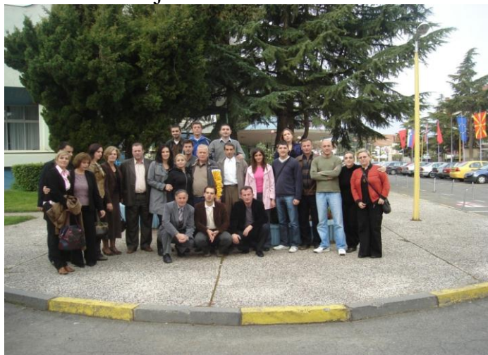
Foto nga përfaqësuesit e punëtorisë të mbajtur në Strugë dhe nisma e projektit: "Krijimi i mjediseve të sigurta dhe jo të dhunshme në shkolla".

Kanë vazhduar aktivitete me të rinjtë në të gjitha rajonet në kuadër të Rrjetit të edukatoreve bashkëmoshatarë me realizimin e tryezave të rrumbullakëta në të gjitha rajonet. Rrjeti i edukatoreve bashkëmoshatarë është iniciativë e të rinjve e që ka për qëllim promovimin e konceptit të edukimit bashkëmoshatarë si qasje e informimit dhe edukimit të rinjve në parandalimin e HIV/AIDS-it, promovimit të aftësive për jetë dhe edukimit shëndetësor, mbrojtjes së ambientit, etj. Në Kornizën e Kurrikulës së re të Kosovës, sfera e shëndetit është vendosur fushë më vete për t’u trajtuar si tema të veçanta gjatë gjithë shkollimit për nxënësit, për të krijuar njohjet dhe shkathtësitë e duhura për shëndetin individual dhe të përgjithshëm në kohët e sfidave të reja.