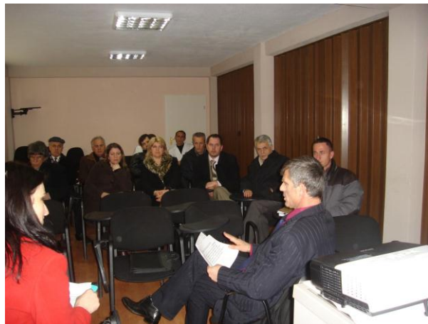
Qendra Komunale e Mjekësisë Familjare në Ferizaj

Në qershor të vitit 2009, dy përfaqësues të Kosovës (koordinitorja e programit dhe kryetarja e Komitetit ndërministror) kanë qenë pjesëmarrës në Konferencën e tretë ndërkombëtare të edukimit dhe promovimit të shëndetit në Vilnius të Lituanisë me temë "Better schools through health" (shkolla më të mira të shëndetshme).