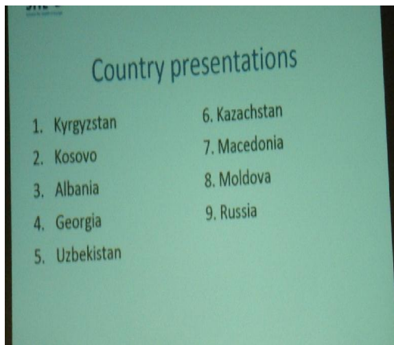
Prezentimi i shteteve pjesëmarrëse në punëtorinë SHE, Mavrovë.