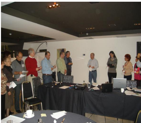
Foto nga punëtorja e koordinatoreve nacional- Schools for Health in Europe, Mavrovë 2009