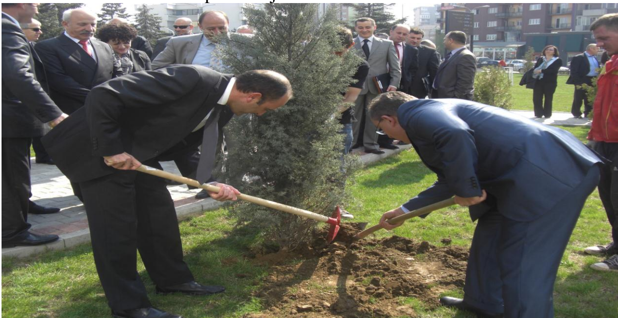
Foto gjate mbeltimit te fidneve nga dy ministrat e MASHT dhe MMPH

MMPH në bashkëpunim me MASHT për çdo vit kanë shënuar festat mjedisore si 22 Marsin Diten e Ujit, 22 Prillin - Ditën e Tokës, këtë ditë ku janë mbëltuar fidane dhe lule dekorative pranë objektit të MASHT dhe MMPH.