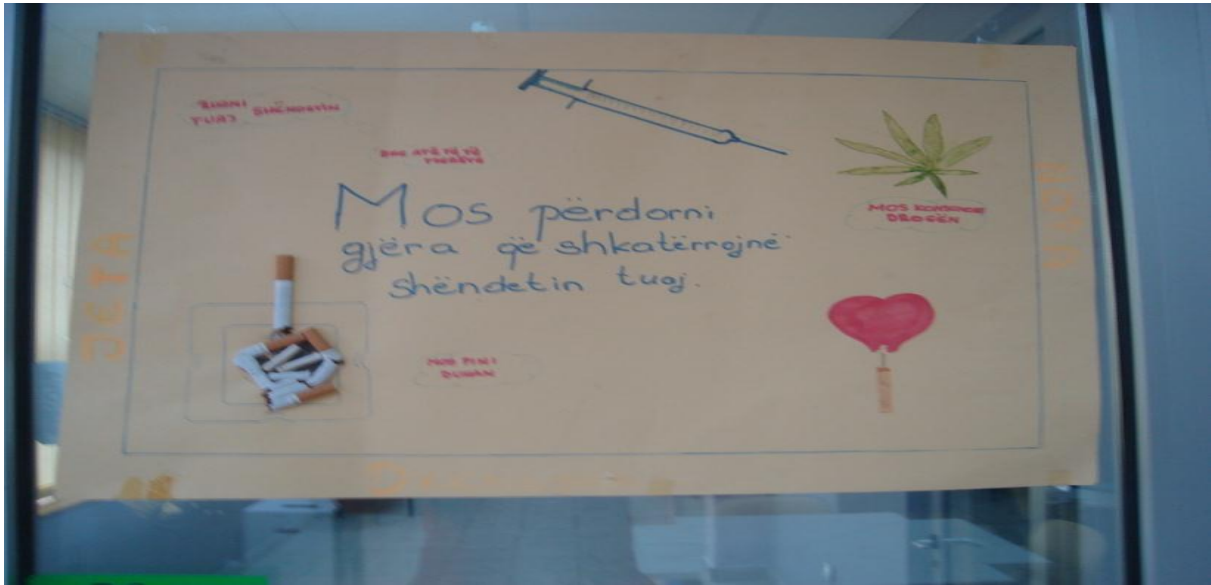
Foto nga punimet e nxënësve gjatë ekspozimit të ekspozitës në Ferizaj, gjatë javës së promovimit 2009