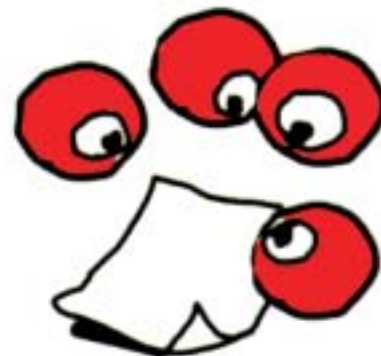
Organizimi i grupit