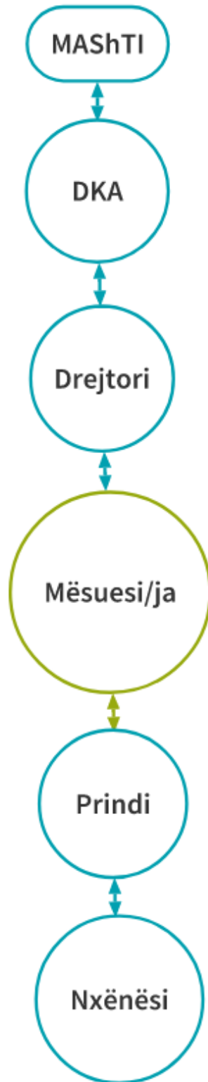
FIG. 2. PARAQITJA GRAFIKE E KOMUNIKIMIT NDËRMJET PALËVE TË INVOLVUARA NË REALIZIMIN E MËSIMIT NË DISTANCË PËR KLASËT 1-5